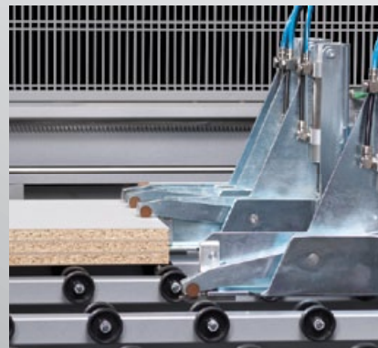
Mordazas con control neumático que aseguran la cogida perfecta del material